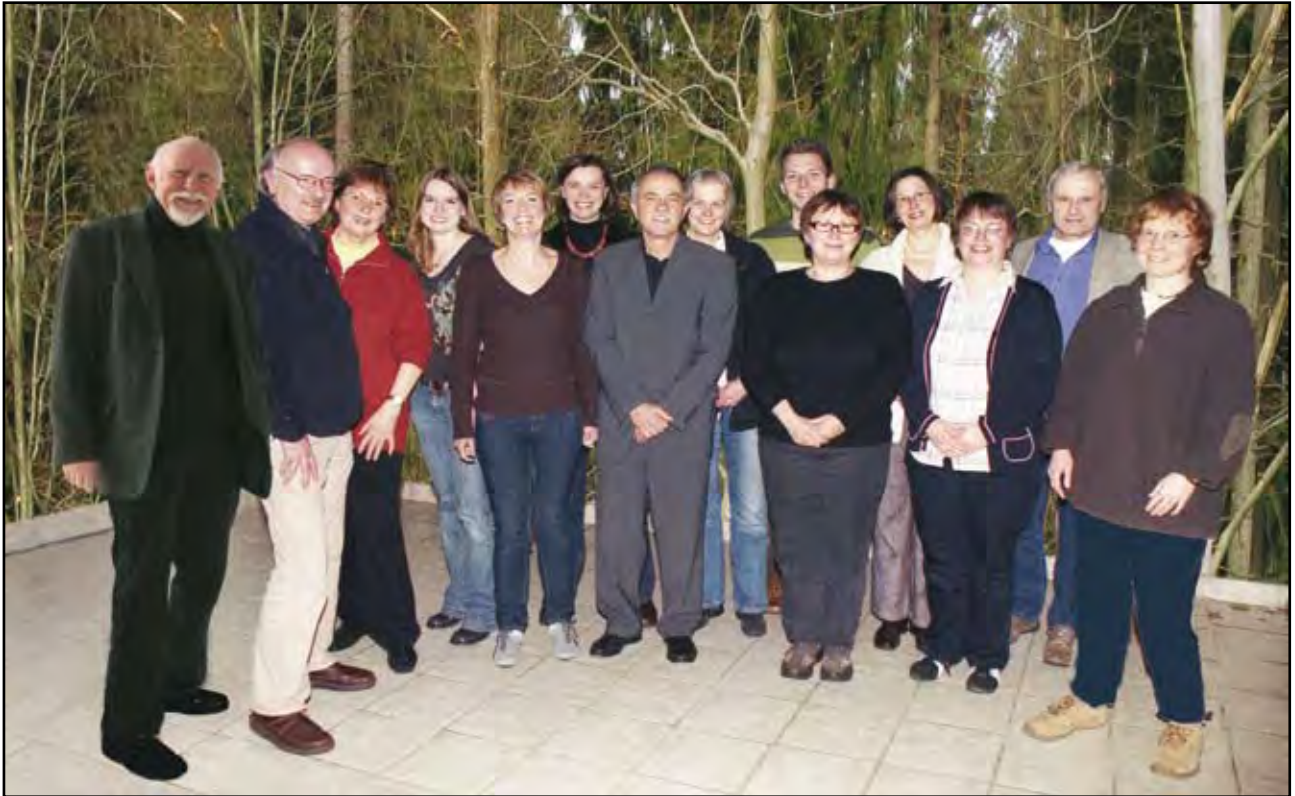
Unsere Mannschaft - in den Wald gesetzt