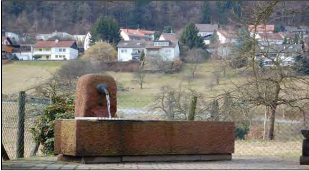
Brunnen im Mitteldorf

Es war schon ein Schock, als wir erfuhren, wie gefährlich das Wasser des oberen Hesselbrunnens schon ist. Die Gemeinde Schriesheim, auf deren Gemarkung der Brunnen liegt, hatte ihn Ende November 2008 untersuchen lassen. Daraufhin stellte der Schriesheimer Bürgermeister ein neues Warnschild auf, das nach kurzer Zeit wieder verschwunden war.