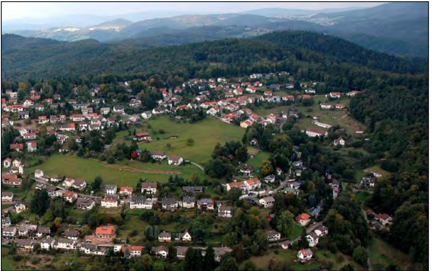
In der Bildmitte: Die Wiese am Rainweg

Auf die Gemeinde kommt in diesem Fall nicht nur eine große finanzielle Belastung zu, sondern auch der Unmut der unzufriedenen, verärgerten Anwohner.