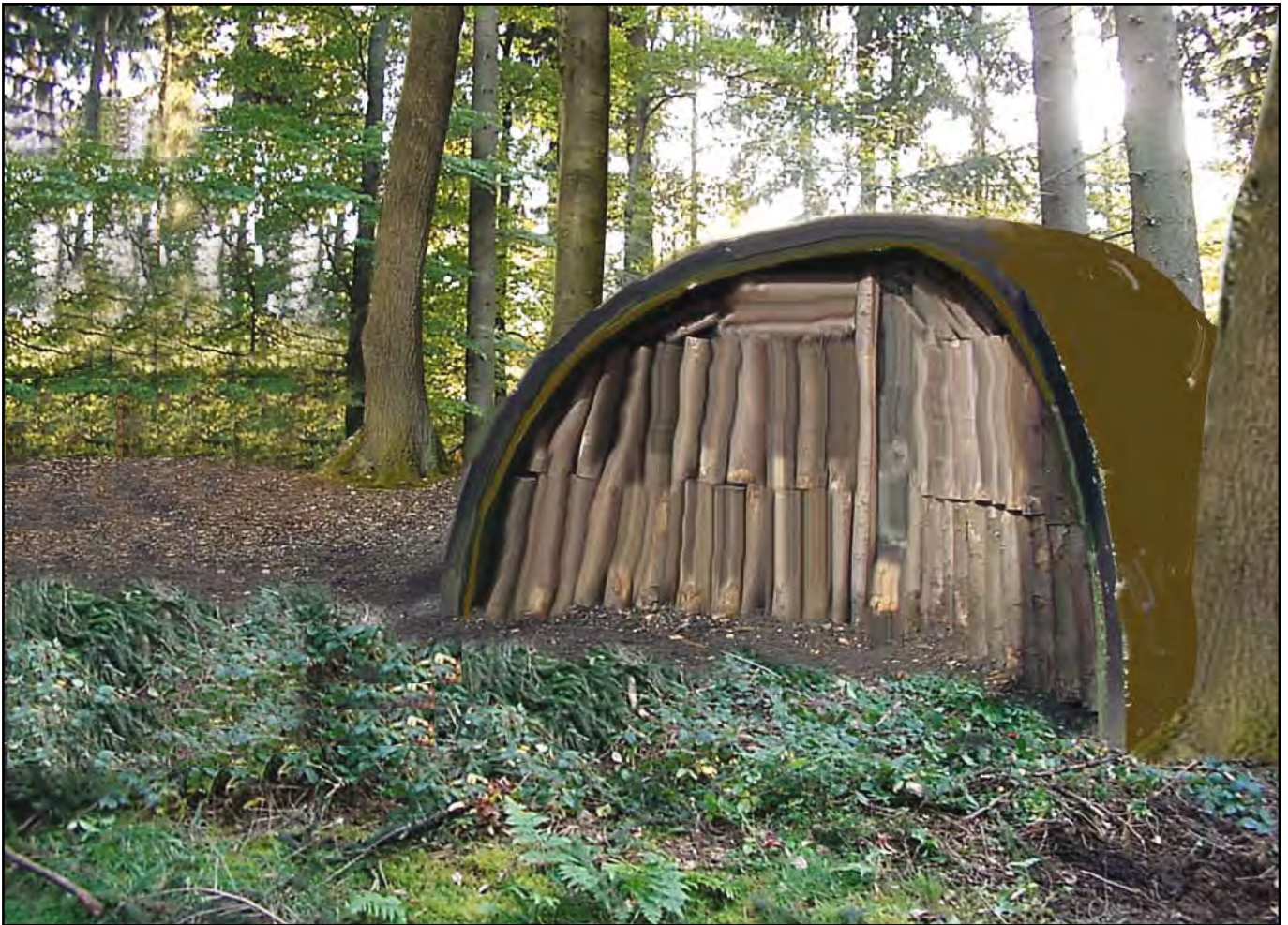
So könnte der Schaumeiler aussehen