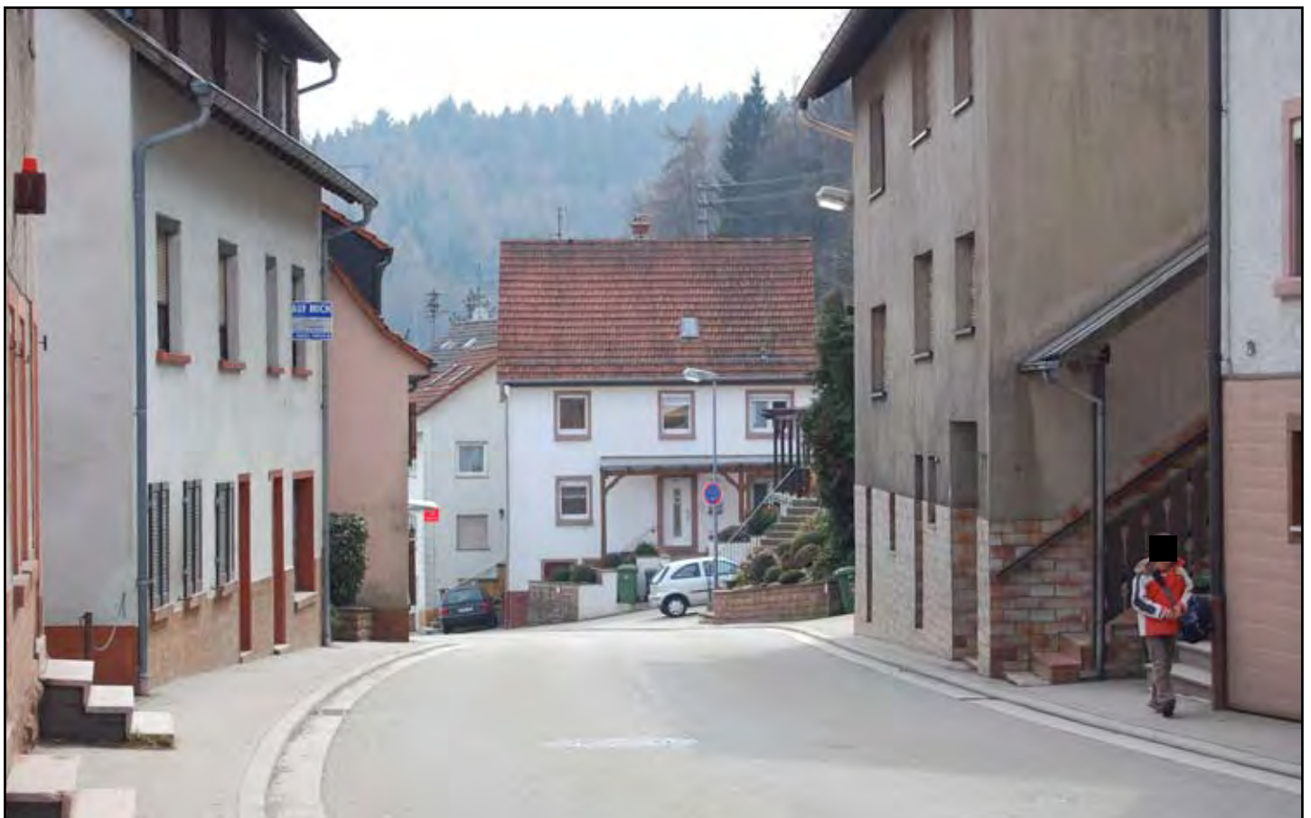
Schulweg in Wilhelmsfeld 2009