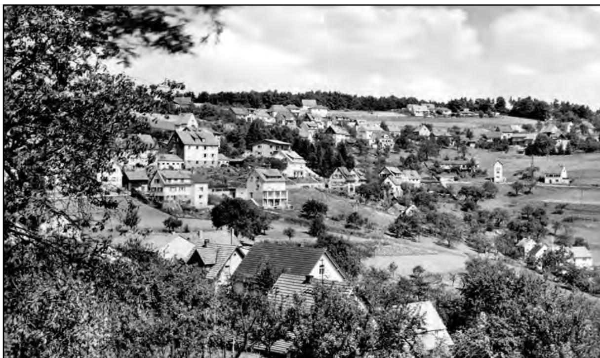
In den 1950ern, als es noch mehr Obstbäume gab