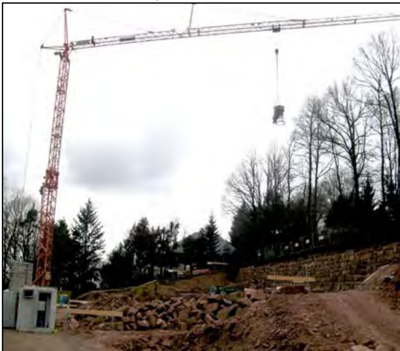
Die Erdarbeiten schreiten voran

Welche Probleme aus der unglücklichen alleinigen Anbindung des Seniorenzentrums über den Panoramaweg (von einigen beteiligten Leuten schon Dackeleingang genannt) bei Notfällen (Feuerwehr, mehrere Rettungsfahrzeuge, Blockade für Rettungsfahrzeuge durch Anlieferer usw.) entstehen können, brauche ich wohl nicht weiter auszuführen.