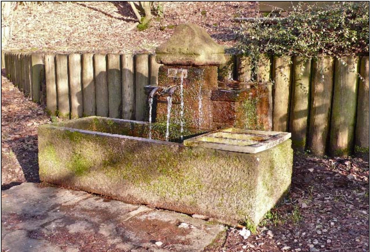
Quellwasseruntersuchung - Ergebnisse in dieser Eule Seite 7