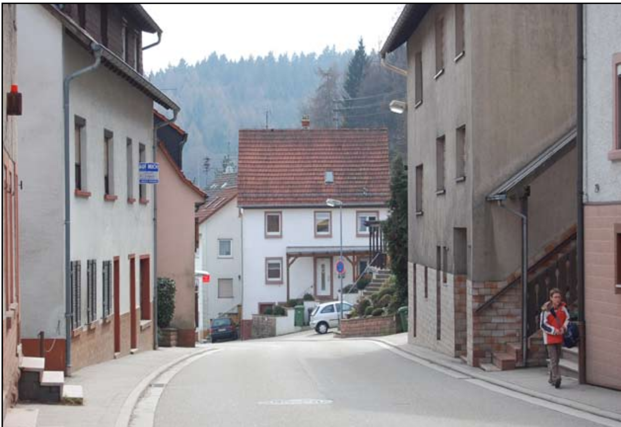
Immer noch das gleiche Bild: Schulweg in Wilhelmsfeld 2011

Umso wichtiger ist es darauf zu achten, dass die Lebensqualität in Wilhelmsfeld erhalten bleibt! Dazu muss sich das Land und die Straßenbauverwaltung bewegen. Nicht nur der Durchgangsverkehr zählt, auch die Menschen, die an der Landesstraße wohnen. Ganz gleich, ob die Verkehrszunahme 10 oder 50 Prozent beträgt, verkehrsberuhigende Maßnahmen sind wichtig!