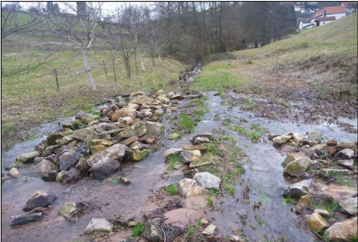
„Die Bach“ sucht sich ihren eigenen Weg